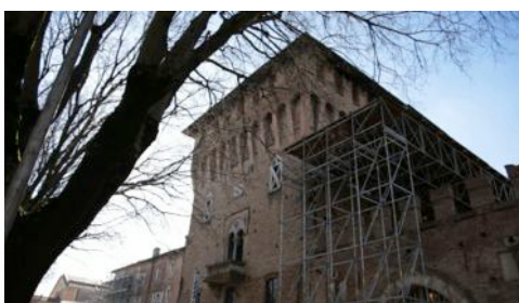
Centro storico, Mirandola