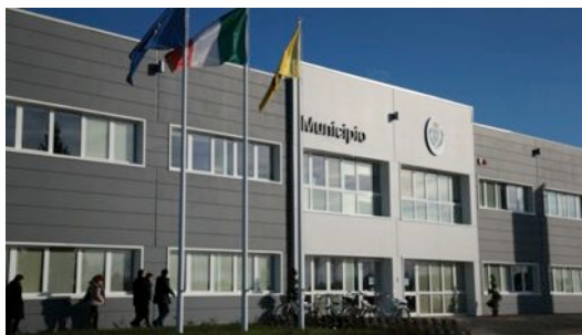
Nuovo Municipio di Mirandola